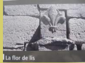
La flor de lis

Este símbolo representa una flor, ¿cuál?. LA FLOR DE LIS. "Lis" en gallego significa lirio.