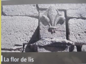
La flor de lis

Pon los números en el recuadro que corresponden a cada punto y busca las soluciones a las preguntas en los elementos del parque.